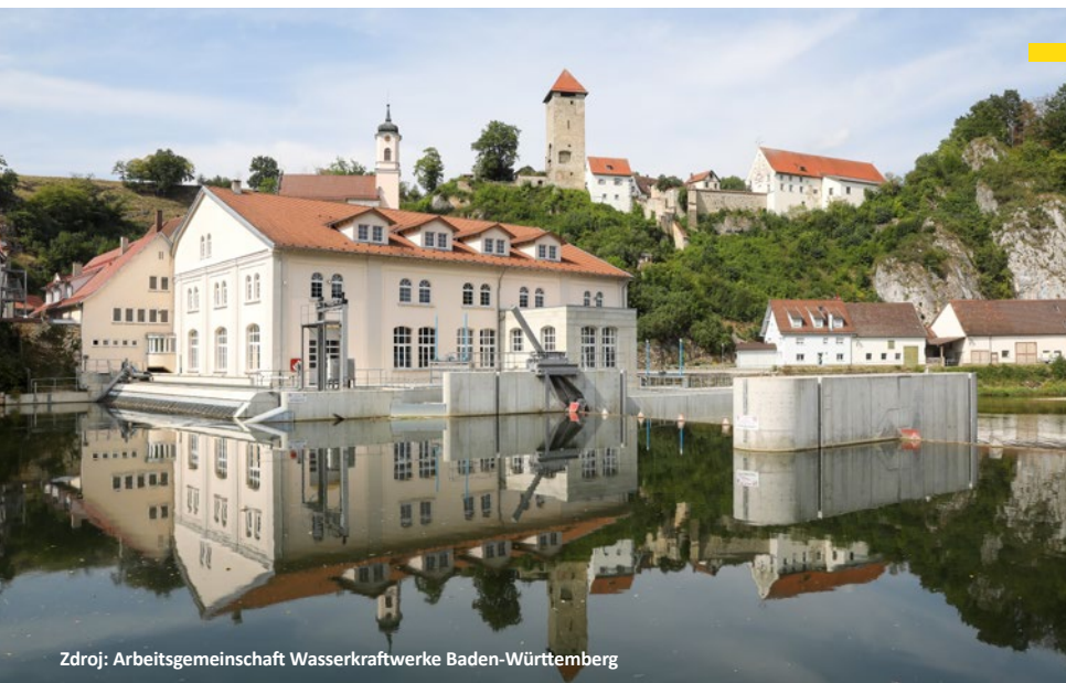
Zdroj: Arbeitsgemeinschaft Wasserkraftwerke Baden-Württemberg